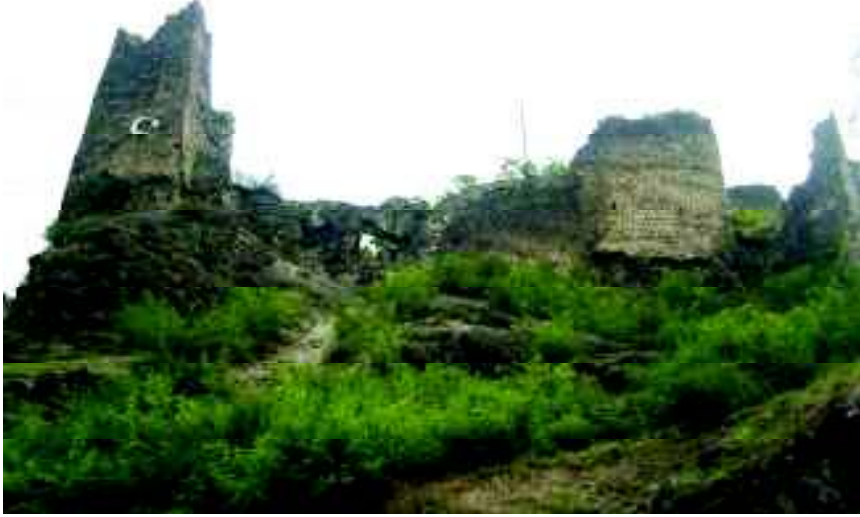
Ek:1. Şavşat Kalesi