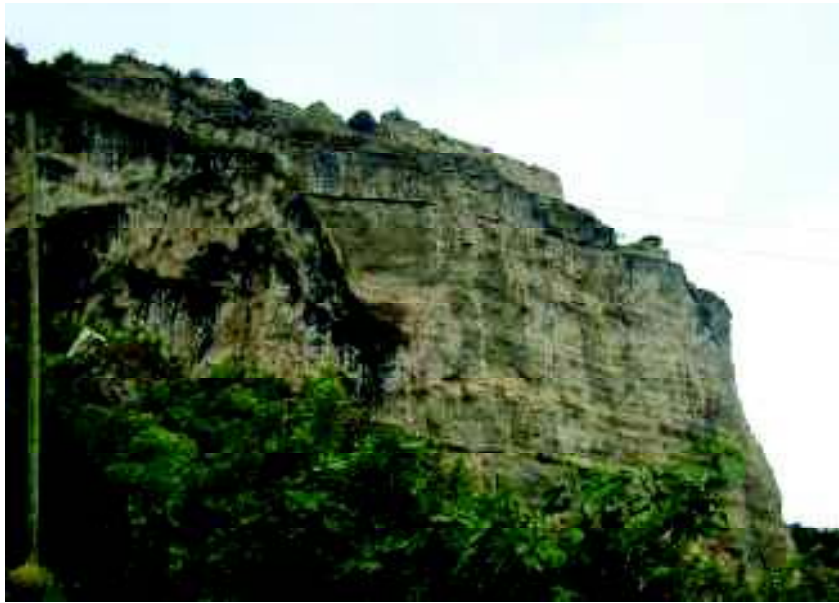
Ek:2. Ardanuç/Gevhernik Kalesi