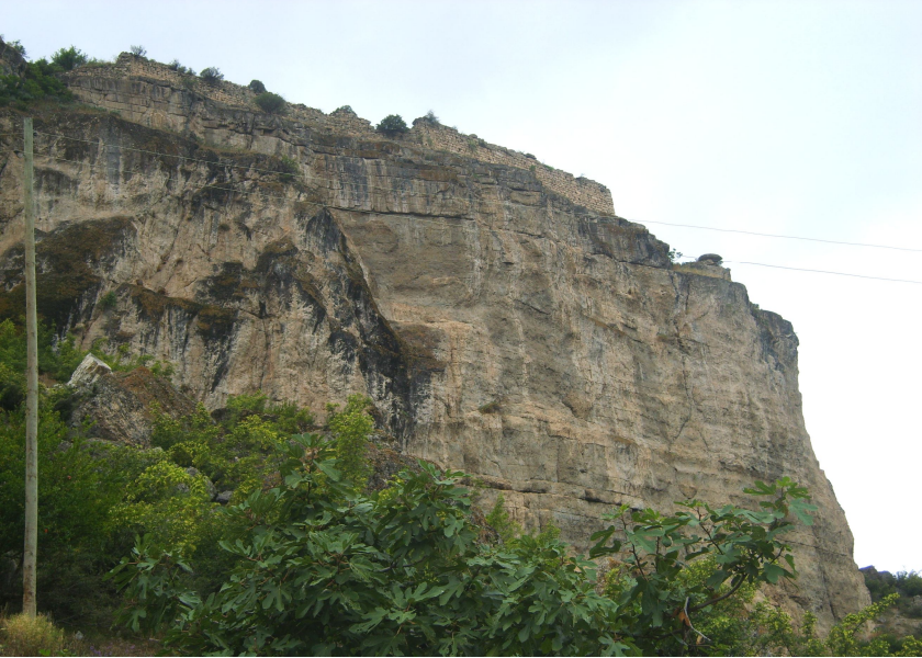
Ek:2. Ardanuç/Gevhernik Kalesi