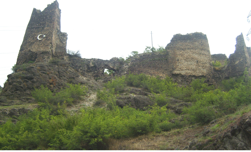
Ek:1. Şavşat Kalesi